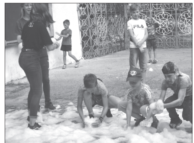
Пена... Что делать с этим богатством?