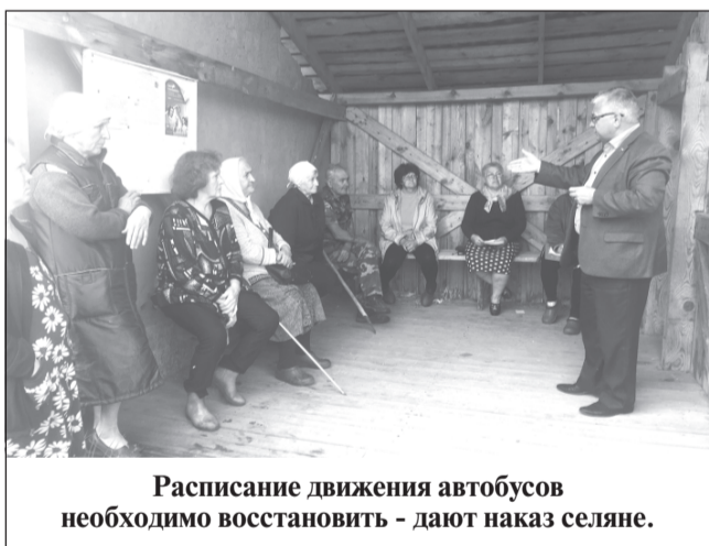
Расписание движения автобусов необходимо восстановить - дают наказ сельяне.

В ходе приема были подняты вопросы благоустройства, работы общественного транспорта и др.