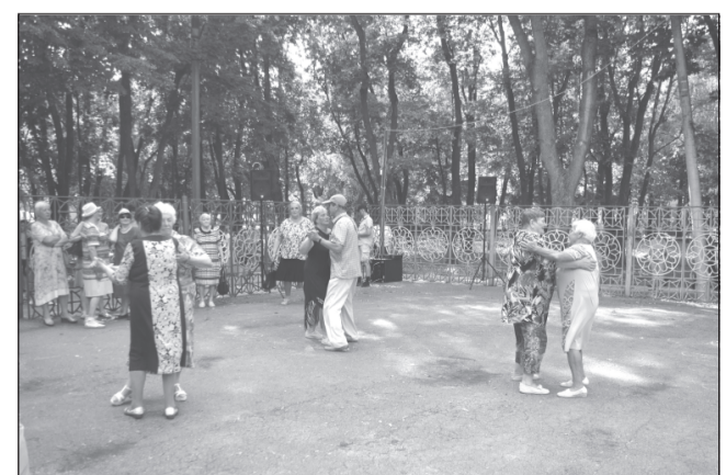
В ритме вальса.