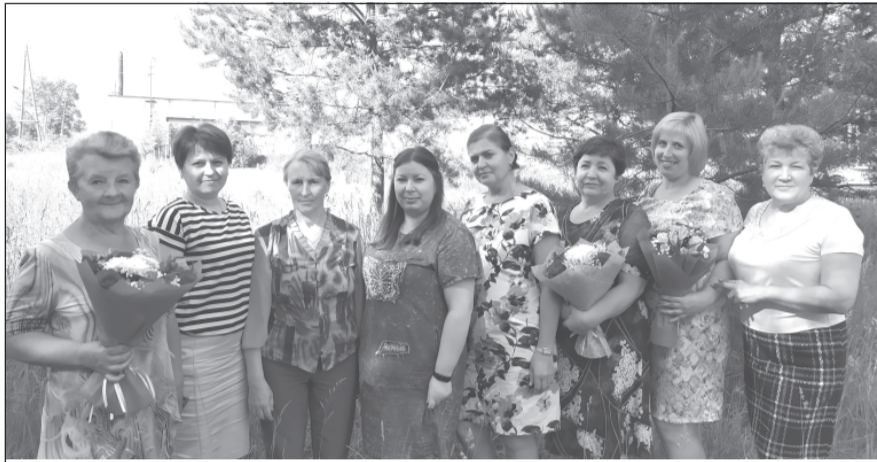
Сотрудники ЦРБ, отмеченные благодарностями.

печение, которое будет универсальным для всех медицинских учреждений Ивановской области. Также система позволит внедрить элементы телемедицины – возможность консультирования в сети интернет врачами областных учреждений здравоохранения.