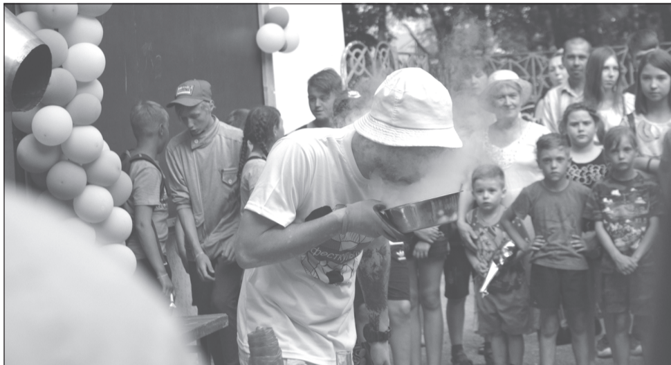
Ну как там каша?

Сад «Текстильщик» в этот день тоже не скушал в одиночестве, и ему досталось внимание горожан. Правда, его «звёздный час» наступил вечером.