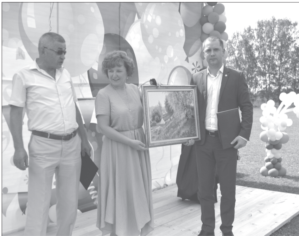
Церемония вручения подарков.