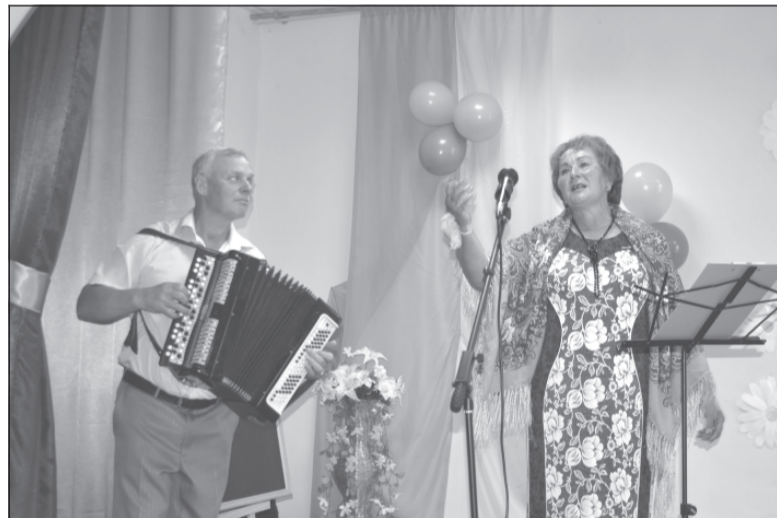
И работать, и петь мастерицы.