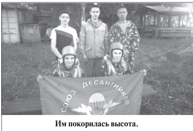
Им покорилась высота.