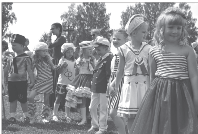
Дошколята на «Регате».