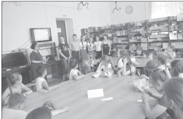
Внимание на старших. Юные ведущие читают стихи Пушкина.

220-летний юбилей А.С.Пушкина – это событие, которое нельзя обойти стороной. Сотрудники Приволжской центральной городской библиотеки (ЦГБ) подготовили для этой даты специальное мероприятие, пригласив принять в нём участие ребят из школьных лагерей.