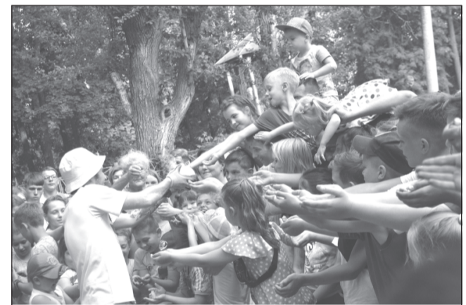
Волшебного угощения достанется всем.