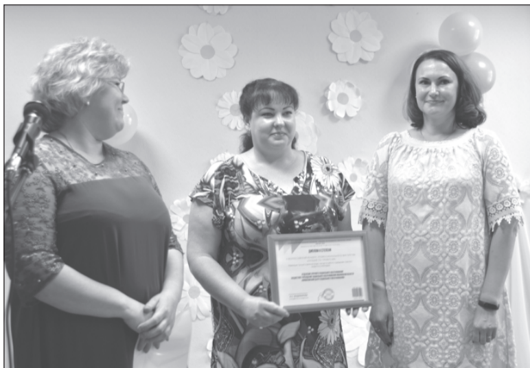
Вручение заслуженных наград.