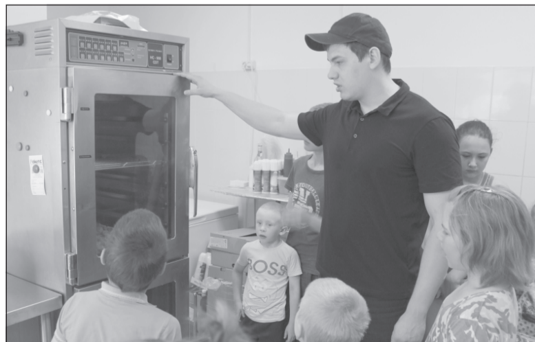
Экскурсия на кухню.

Оказывая помощь, вы дарите радость и надежду детям.