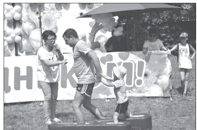
Мы с отцом не подведём!