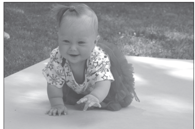
Вперёд к победе!